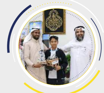
ربوو جدة 13